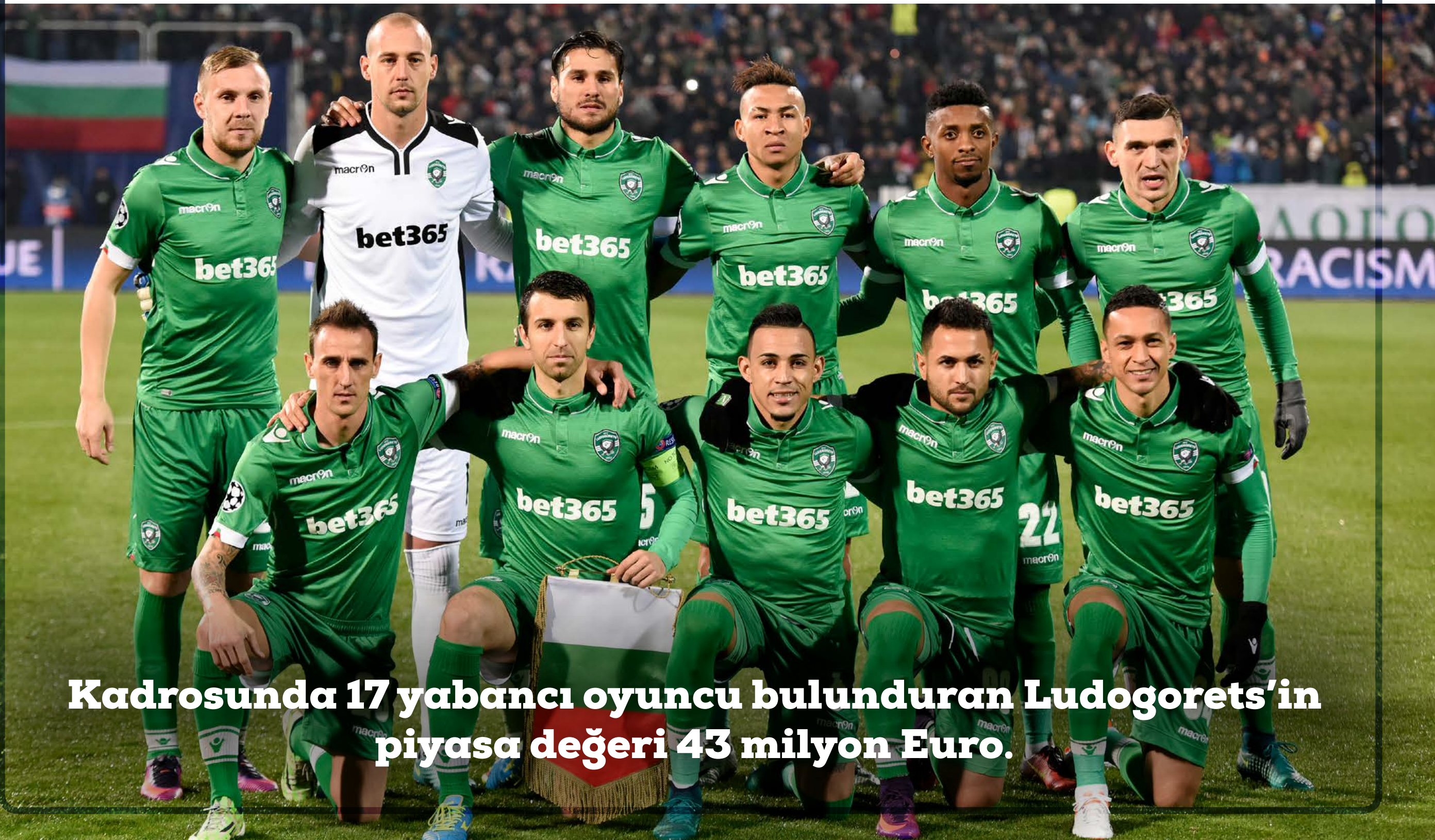
Kadrosunda 17 yabancı oyuncu bulduran Ludogorets'in piyasa değeri 43 milyon Euro.

Ludogorets örneğini daha önce Rusya'da Zenit Petersburg ve Rubin Kazan, Ukrayna'da Shakhtar Donetsk, Romanya'da CFR Cluj ile gördük. Bu takımlar devletin elini başkent takımlarından çekmesiyle zenginler tarafından satın alınarak, şampiyonluğa ulaştılar. Ludogorets bu şekilde devam ederse uzun yıllar şampiyonluğu kimseye kaptırmayacak gibi görünüyor. Kadro kalitesi ve oyuncularının toplam değeri bu tezi doğrulayan en önemli kanıt.